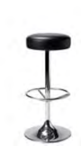
Barstol Gothenburg , svart (läder) Sitthöjd 83 cm