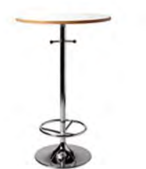
Ståbord Athens , vit (trä) H 110 x diam 70 cm